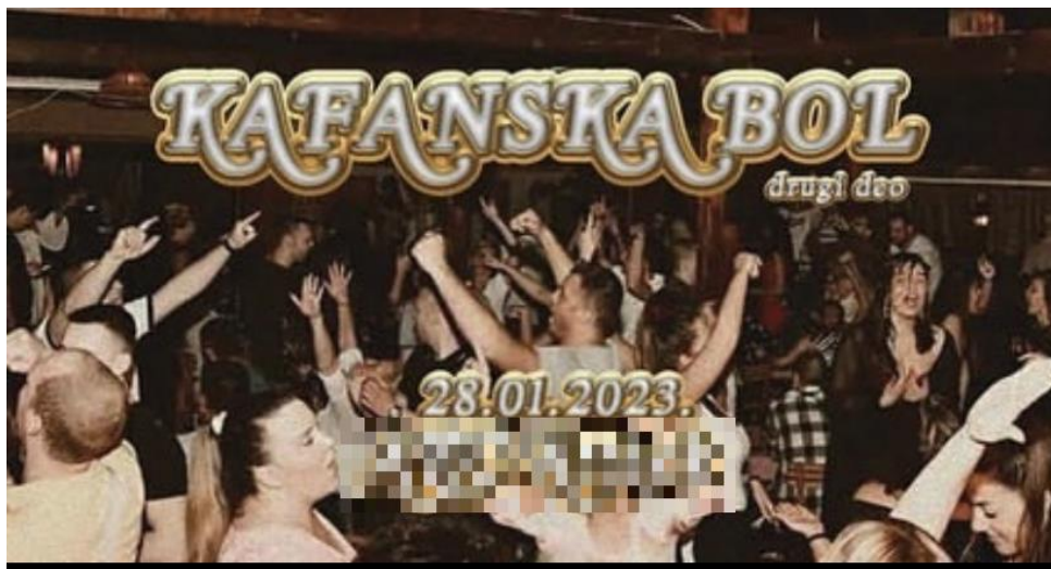
Slika 1. Vizual događaja pod nazivom 'Kafanska bol, drugi deo' organiziranog u bivšem skvotu, a trenutno klubu u kojem se organizira najveći broj punk koncerata

Pan je još kritičniji kada je riječ o turbofolku te zaključuje "to nije glazba. To po meni nije glazba", ali ipak dodaje kako postoji razlika između turbofolka i narodnjaka (razlika koju prepoznaje i Max), iako se ti pojmovi, zajedno s pojmom cajka često koriste kao sinonimi: "Velika je razlika između cajki i narodnjaka [...], to je čista naša, stara, jugoslavenska glazba i ja nemam ništa protiv toga" (Pan). Jednako kritična je i Vivienne kada opisuje kako su njezini roditelji utjecali na njezin pogled na turbofolk: "Ja sam tako odgojena da su oni mene učili da ne trebam slušati cajke i narodnjake jer je to ta neka loša, nekvalitetna glazba i ja ono, nikad nisam smjela pred njima puštat takvu glazbu i slušat' takvu glazbu. Niti jesam" (Vivienne).