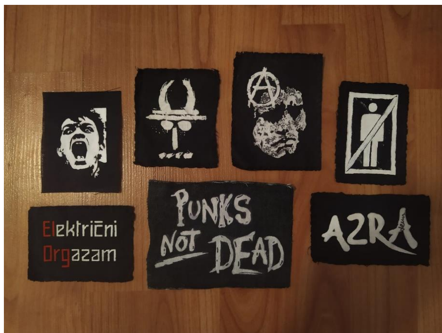
Slika 8. Jakna koju je uredio Pan