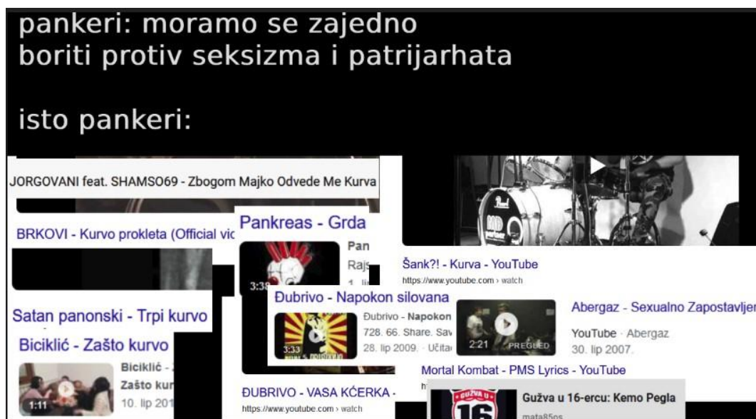
Slika 3. Vizual koji je napravio sudionik istraživanja, želeći otvoriti diskusiju o (ne)postojanju seksizma na punk sceni

Primjer "puzajućeg seksizma" koji Zagi spominje i neosviještenosti o njegovim primjerima na punk sceni, spominje Chrissie kada prepričava svoje iskustvo: