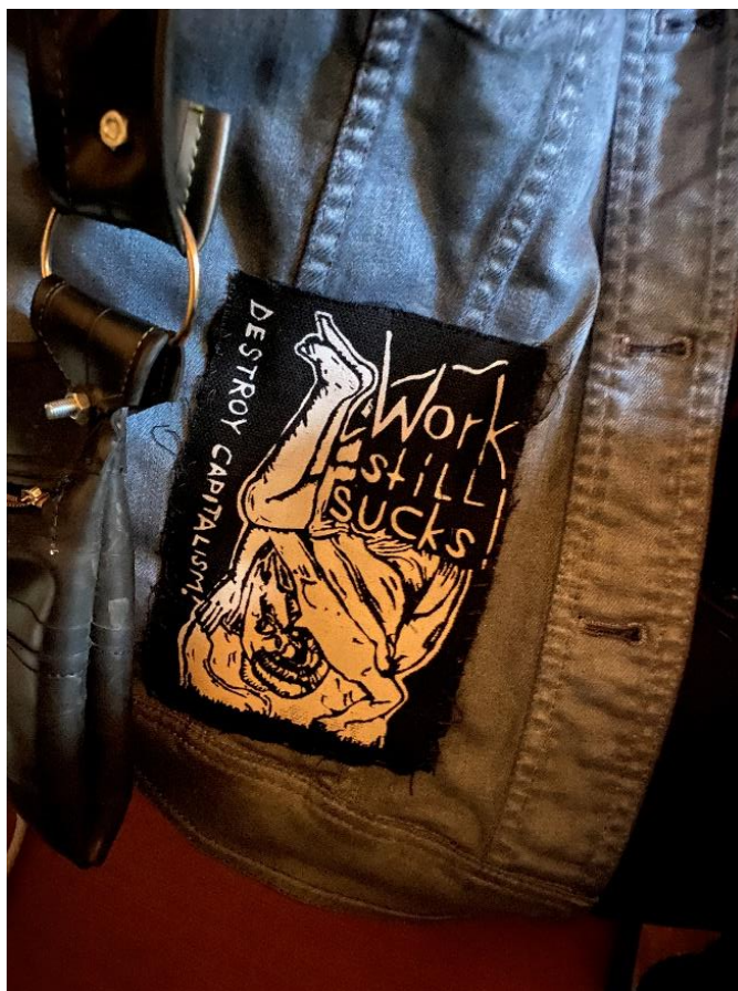
Slika 9. Prišivak "Destroy capitalism! Work still sucks!"

Nešto što se jako često spominjalo među sudionicima kada smo razgovarali o njihovom stilskom izričaju ili onom koji primjećuju kod drugih aktera scene, vezano je uz prišivke. Sami prišivci su vrlo česti u punk supkulturi i jedan su od najboljih primjera udruživanja stilskog izričaja i DIY kulture, pogotovo kada akteri izrađuju prišivke za sebe ili druge.