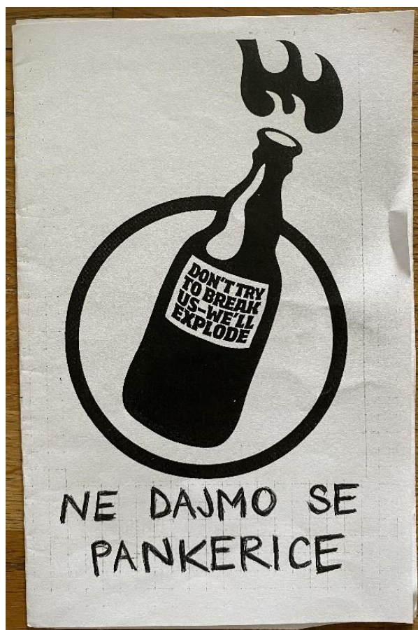
Slika 4. Pamflet sudionice istraživanja, pod nazivom "Ne dajmo se pankerice"

Govoreći o razlikama u odnosu muškaraca i žena u različitim grupama unutar punk scene, Sheila ističe kako na strani nekih desnih grupa unutar punk supkulture rjeđe vidi žene: "Mislim da je puno veća koncentracija muškaraca u tom svijetu, dok onak' na toj ljevičarskoj strani, nazovimo, punka, je dosta izjednačeno" (Sheila). Patrik zaključuje nešto slično i napominje: "Ako vidiš ekipu skinsa ili punkera, ako vidiš cure s njima većinom su onda ok. Al' ak vidiš ekipu da nema ni jedne cure, onda je onak' ... onda će se vjerojatno potuć' zbog cigare" (Patrik). Objasnjavajući nadalje svoje iskustvo odnosa između muškaraca i žena na sceni, Patrik napominje da je taj odnos uvijek bio zanimljiv, ali jako dobar: "[...] cure i dečki su tu fakat isti, znači zajedno cugamo, cure se isto ponašaju tak', dečki se ponašaju nekak', znaš ono, najnormalnije, kužiš. Svi su, čini mi se, jednaki, nema neke granice ono cura – dečko da bi sad neko maltretirao curu, ali je velika tolerancija" (Patrik). Nadalje, opisujući na što misli pod tim dobrim odnosom, daje primjer odnosa s nekim prijateljicama iz srednje škole: "Da sam se ja