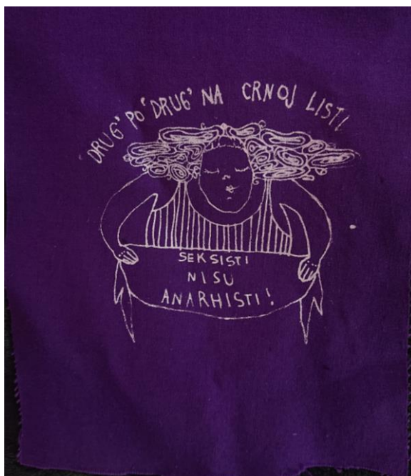
Slika 12. Crtež na torbi koji je izradila sudionica