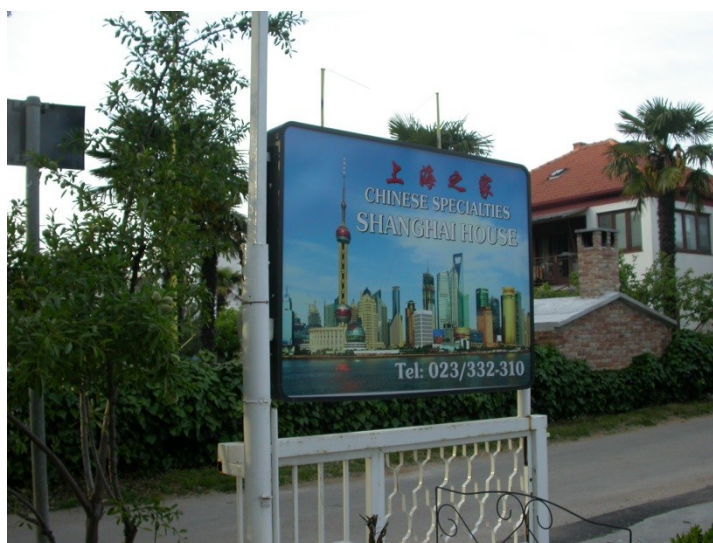
Slika 6. Reklama kineskog restorana u ulici Put Dikla (28.4.2012.)

da ih u 2019. godini više nema, dok je kineski restoran i dalje na istoj lokaciji u vrijeme pisanja ovoga teksta u ljeto 2019.