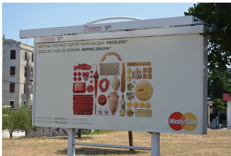
Slika 35. Reklama za kreditnu karticu na engleskom i hrvatskom jeziku (4.8.2013.).