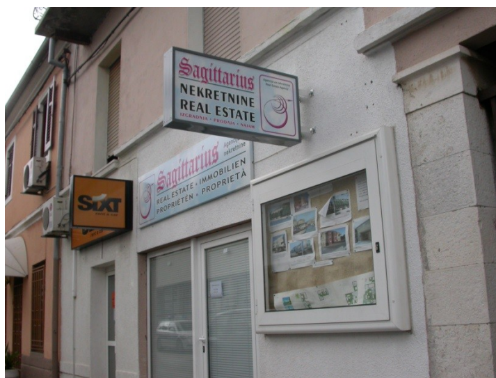
Slika 14. Latinski jezik u nazivu agencije za promet nekretnina u Ulici Ivana Mažuranića (22.4.2012.)

Ako bismo promotrili koji su jezici zastupljeni u određenim djelatnostima, vidjeli bismo da je hrvatski najviše prisutan na natpisima infrastrukturnih (39,99%), trgovačkih (13,35%), financijskih (3,34%) i medicinskih djelatnosti (2,75%). Engleski je najviše prisutan kod trgovačkih (4,37%) i računalnih djelatnosti (1,03%). Latinski je prisutan kod financijskih i građevinskih djelatnosti, te kod djelatnosti koje se bave prodajom nekretnina i pružanjem intelektualnih usluga. Međutim, ti podaci ne znače da se u tim djelatnostima latinski rabi kao jezik komunikacije; latinski je tamo prisutan zbog činjenice da je odabir naziva tvrtke u Republici Hrvatskoj prije ulaska u Europsku uniju bio reguliran zakonom koji je dopuštao nazive na hrvatskom jeziku ili jednom od klasičnih jezika, pa su mnogi vlasnici odabirali latinske riječi za nazive svojih tvrtki (primjerice „Sagittarius nekretnine“ (Slika 14).