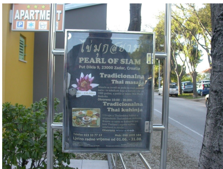
Slika 7. Reklama tajskog restorana i salona za masažu u ulici Put Dikla (28.4.2012.)

Gledajući prema žanru (Tab. 15), najveći broj natpisa odnosi se na objekte (OBJ) (55,72), što uglavnom uključuje kanalizacijske poklopce. Sljedeća su skupina reklamni natpisi (REK) (24,11%), što je razumljivo s obzirom da se radi o četvrti uz morsku obalu koja je turistički valorizirana i ima određen broj ugostiteljskih, trgovačkih i smještajnih prostora. Ostalih