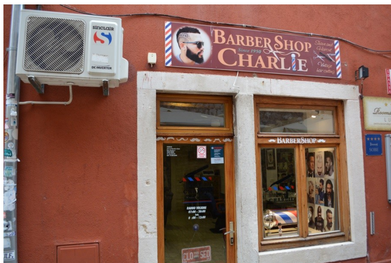
Slika 33. Brijačnica u ulici Špire Brusine (21.10.2018.).