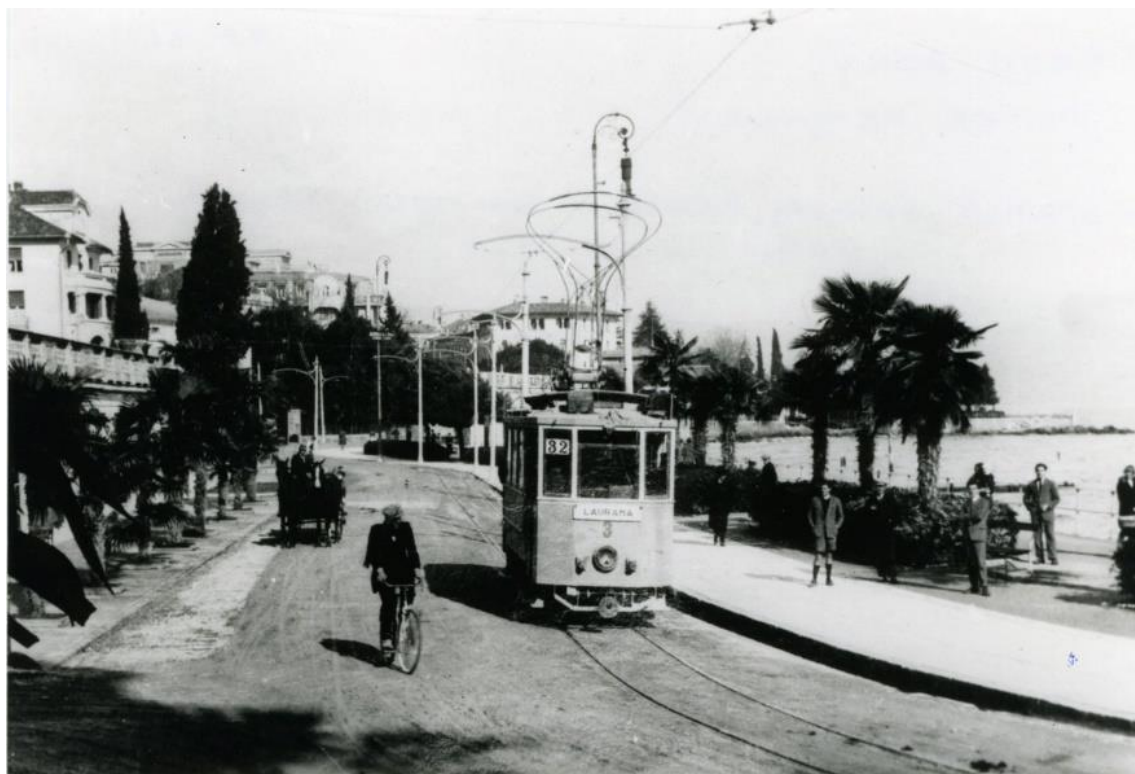
Slika 6. Opatijski tramvaj 1933. godine