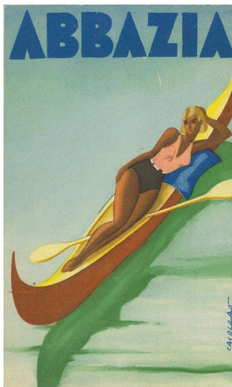
Slika 8. Turistički prospekt Opatije iz 1936. godine