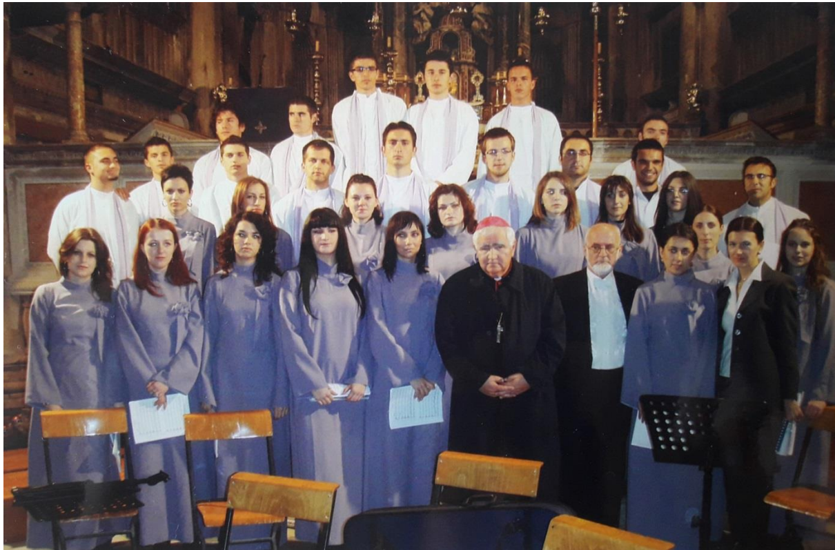
Slika 11. Nakon izvedbe „Dona eis Requiem“ u Šibeniku s biskupom Antom Ivasom