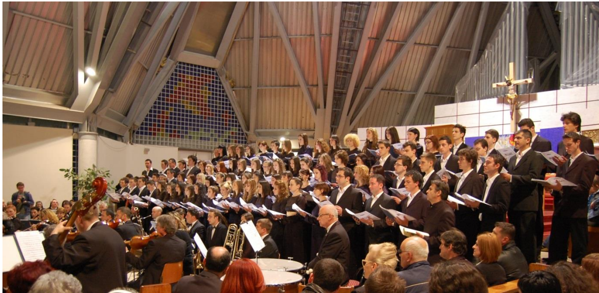
Slika 13. Izvedba Mozartova „Requiema“ u mostarskoj katedrali