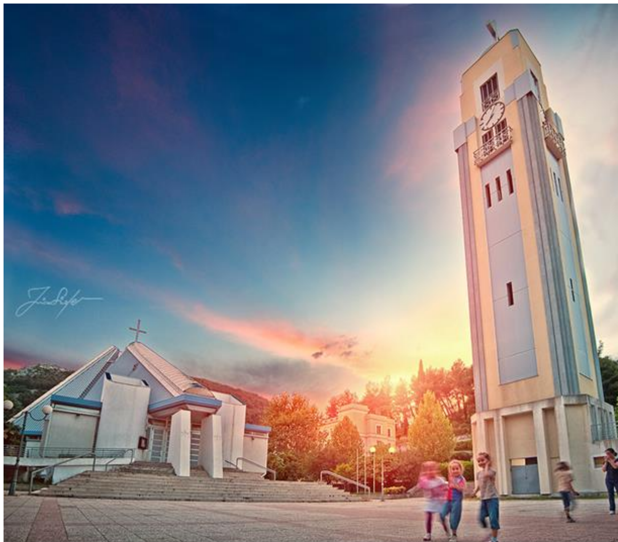
Slika 1. Katedrala Marije Majke Crkve u Mostaru

https://www.google.com/search?q=katedrala+mostar&source=lnms&tbm=isch&sa=X&ved=0ahUKewjQi93qwb7gAhXxoYsKHTxADWYQ_AUIDigB&biw=1366&bih=662#imgrc=WXLuo-1nyLSTAM