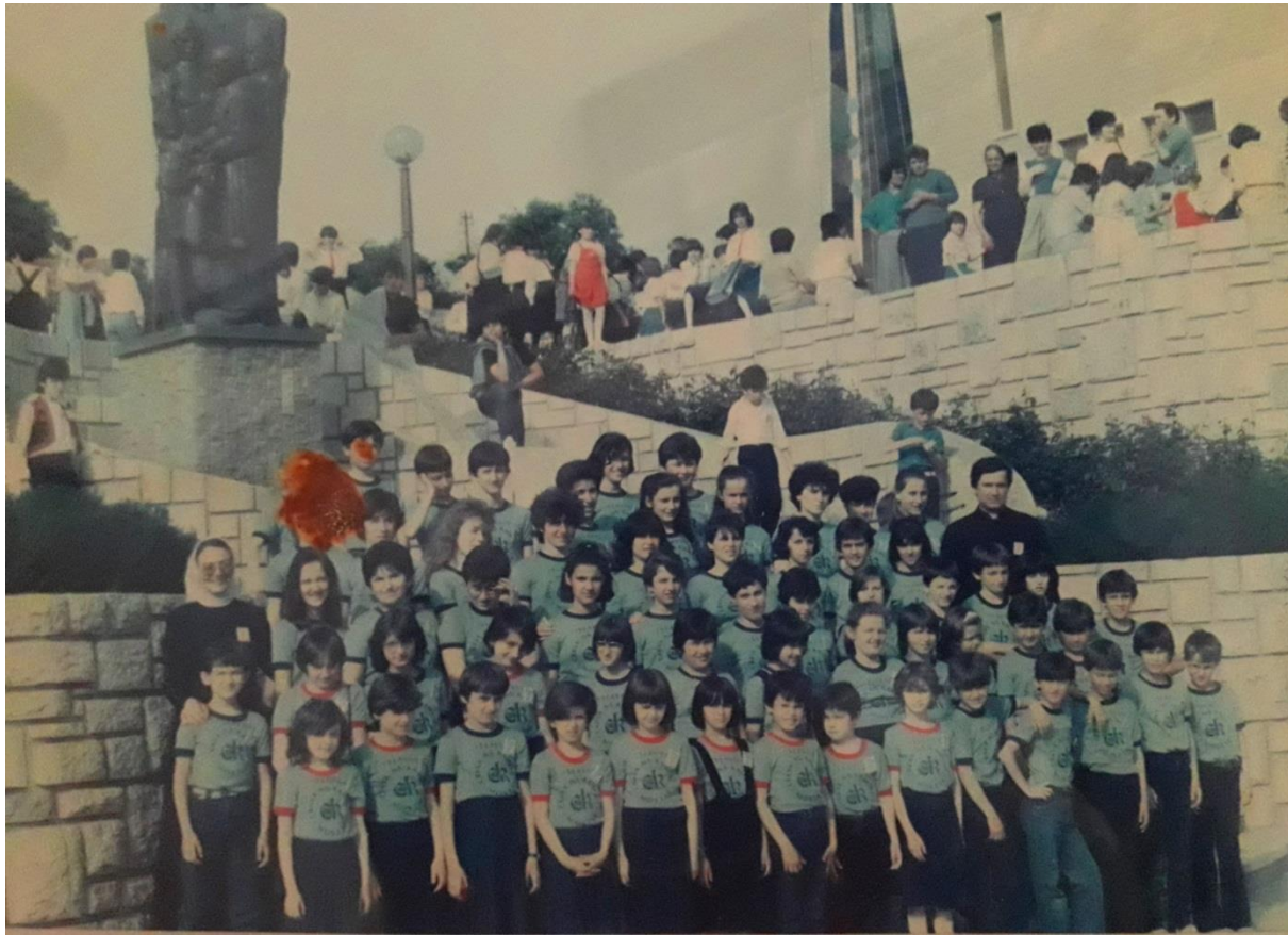
Slika 9. Dječji zbor „Slavuj“ u odori nakon nastupa na „Zlatnoj harfi“ 1985. godine (Župni ured mostarske katedrale)

Osim zbarskih, bilo je i mnogo pojedinačnih nastupa kako pjevanja tako i recitacija. Svaki sudionik dobio je prigodni bedž na kojem je bila uočljiva zlatna harfa ukrašena notama. Biskup je podijelio diplome predstavnicima malih zborova, a s. Suzana voditeljima. Djeca su razdragano klicala i pljeskala pri dodijeli svake pojedine diplome. Bili su doista jedno srce i jedna duša. Na koncu je fra Petar Krasić dobio zadatak da komisija izabere dva zbora za koja su smatrali da bi biskupiju najbolje predstavljala na završnoj smotri u Đakovu. Izglasovali su zbor iz župe Široki Brijeg i katedralni zbor iz Mostara. Tako je dječji katedralni zbor dobio priliku nastupiti izvan svoje župe. 179