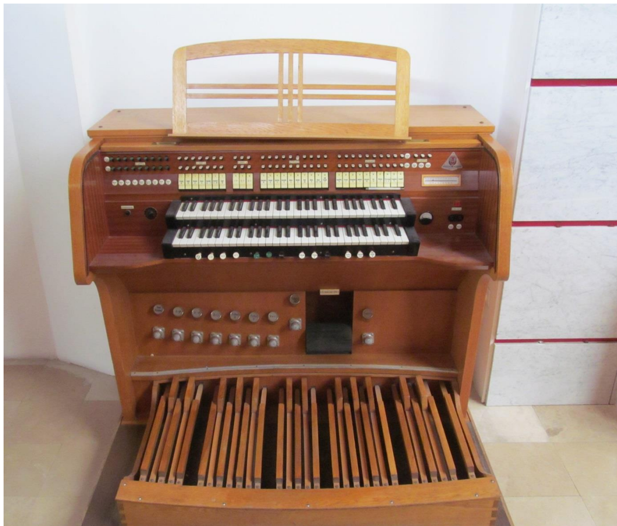
Slika 22. Katedralne orgulje