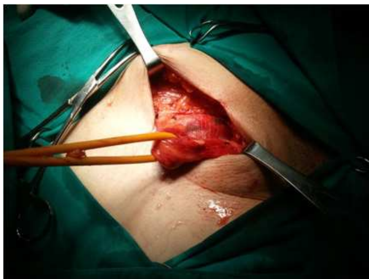
Slika 3. Zaomčeni sjemenski snop uz postavljenu polipropilensku mrežicu