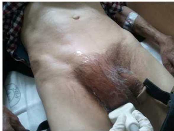
Slika 4. Tehnika mjerenja testikularne cirkulacije

Pacijent u ležećem položaju miruje 10 min, a zatim započinje doplersko mjerenje arterijskih protoka testisa na tri razine: a. testicularis, a. capsularis i aa. intratesticulares (slika 4). Na svakoj arteriji napravljena su tri mjerenja iz kojih smo izračunali srednju vrijednost. Korištena je 10MHz linearna sonda koja nam omogućava vizualizaciju malih vaskularnih struktura. Iz dobivenih spektralnih krivulja izračunata je maksimalna sistolička brzina (PSV), minimalna dijastolička brzina (EDV), indeks otpora (RI) i pulsatilni indeks (PI).