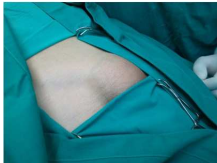
Slika 1. Priprema operacijskog polja u bolesnika sa ukliještenom preponskom kilom

U studiju nisu uključeni pacijenti koji imaju isključujuće čimbenike: prethodno dijagnosticiran poremećaj fertilitnosti, prethodnu traumu ili poznatu bolest testisa, varikokelu, nespecifični uretritis, kronični prostatitis, autoimunu bolest, jetreno oštećenje, imunodeficijenciju i kortikosteroidnu terapiju.