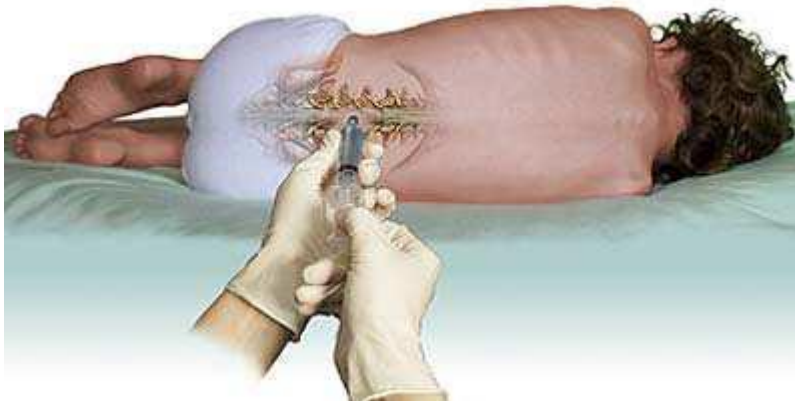
Slika 1. Izvođenje lumbalne punkcije

kralješka. Iznimno je važno bolesniku objasniti potrebu za maksimalno mogućim pregibanjem prema naprijed kako bi se trnasti nastavci susjednih kralježaka razmaknuli. To se postiže postavljanjem bolesnika u supinirani bočni položaj (lijevi ili desni), savijajući vrat tako da ako je moguće brada dodiruje prsa, nogu flektiranih u kukovima i koljenima te maksimalno približenih trbuhu tako da se brada i koljena gotovo dodiruju. Pod glavu se postavlja jastuk kako bi mjesto punkcije bilo na nižem mjestu od moždanih komora. Ako se punkcija izvodi u sjedećem položaju, bolesnika se posjeda na rub kreveta što bliže liječniku, maksimalno flektirane glave prema prsnom košu. Nakon što se osjeti karakteristično „probijanje” dure i ulazak u subarahnoidni prostor mandren igle se može izvući, no vrlo polako kako se ne bi zajedno s likvorom „usisao” i korijen spinalnog živca uzrokujući radikularnu bol. Iradijacija boli duž ishijadičnog živca obično znači da je insercija igle učinjena previše postranično, te je liniju insercije preporučljivo ispraviti. Položaj igle obvezno se ispravlja s mandrenom unutar punkcijske igle, a bolesnik se ne smije pomicati. Iako je „suha punkcija”, tj. izostanak istjecanja likvora unatoč naizgled pravilnom položaju punkcijske igle pokatkad posljedica obliteracije subarahnoidnog prostora kompresivnim promjenama ili adhezivnim arahnoiditisom, ipak se to češće događa zbog nepravilnog mjesta postavka igle za lumbalnu punkciju (14).