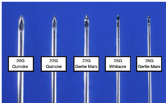
Slika 2. Najčešće korišteni tipovi igala za lumbalnu punkciju