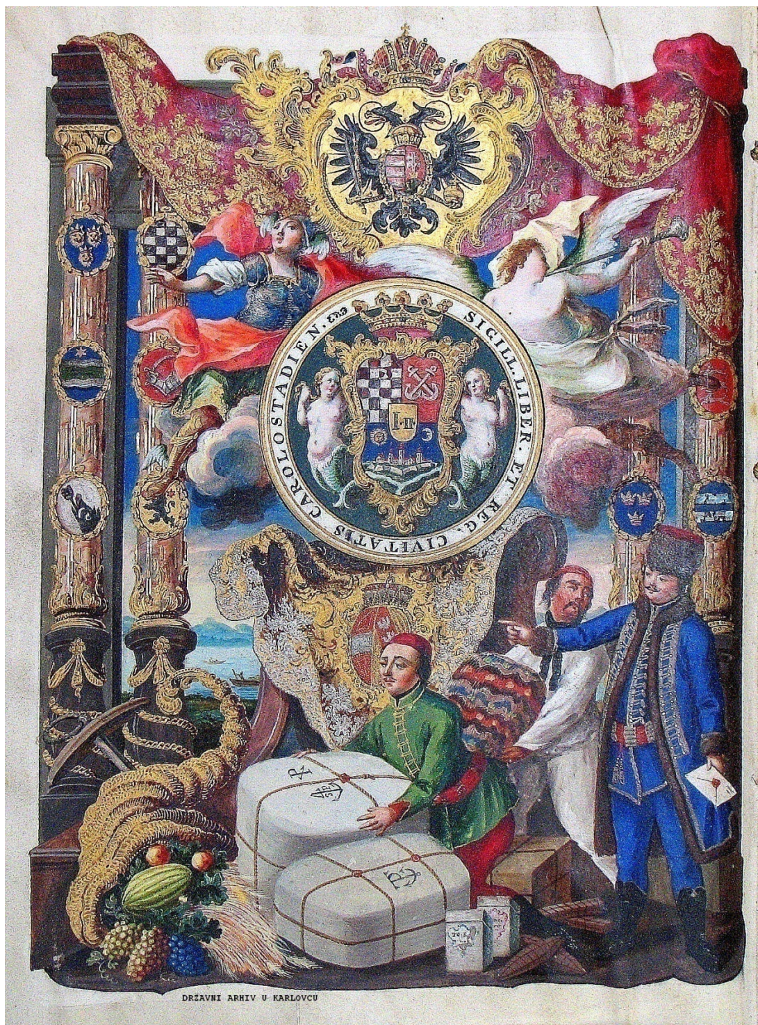
Slika br. 4

Povelja Josipa II. o proglašenju Karlovca sl. kr. gradom iz 1781. g. (prva stranica Povelje)