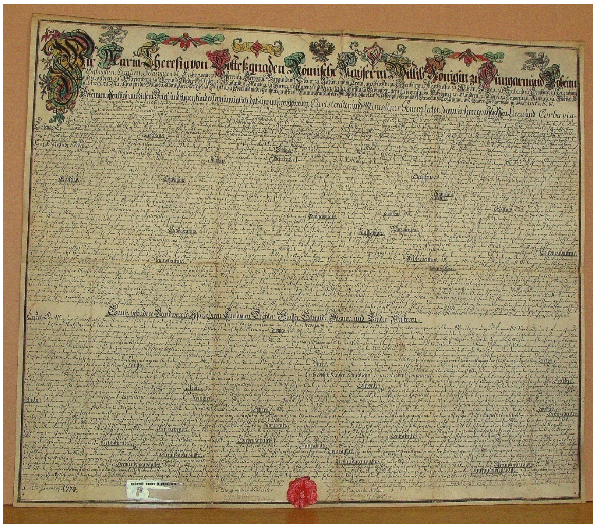
Slika br. 6.

Povelja Marije Terezije cehovima u Karlovačkom i Varaždinskom generalatu iz 1774 g.