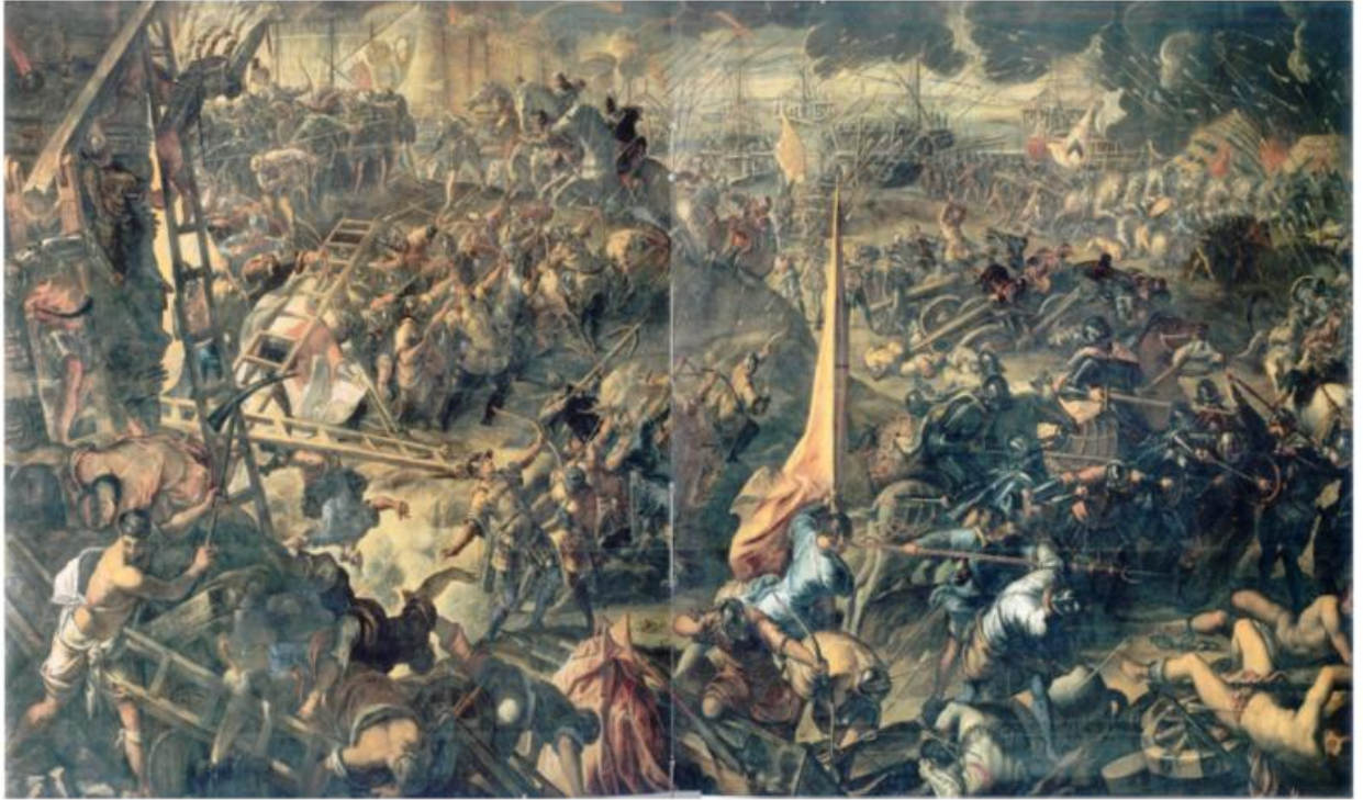
Tintoretto, Vittoria dell'esercito veneziano contro gli Ungheresi per la conquista di Zara 1346.

tradicije kroz prikaz natprirodnih događaja, a upravo su rezultati istraživanja i nova pitanja koja su se otvorila bila poticaj da istraživanje ovog izuzetno zanimljivog i zagonetnog teksta nastavim i u ovoj doktorskoj disertaciji.