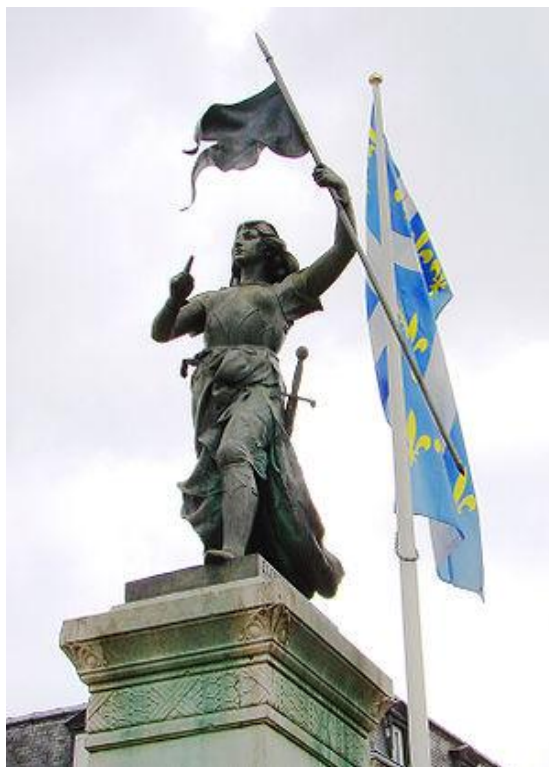
Statua sv. Ivane Orleanske u Parizu

Postoji li povezanost između ovih tema trebalo bi pokazati istraživanje koje će obuhvatiti širi korpus od djela na kojima se temelji ovo istraživanje, a to su ona s opisima opsada grada. Vjerujemo da bi nam ova zagonetna žena mogla još dosta toga reći o istraživanom djelu, ponajviše o vremenu njegovog nastanka. Žena, nalik onoj na Spomenici domovinskog rata, koju su dobili i branitelji opsjednutog Zadra, ali više od pola tisućljeća kasnije.