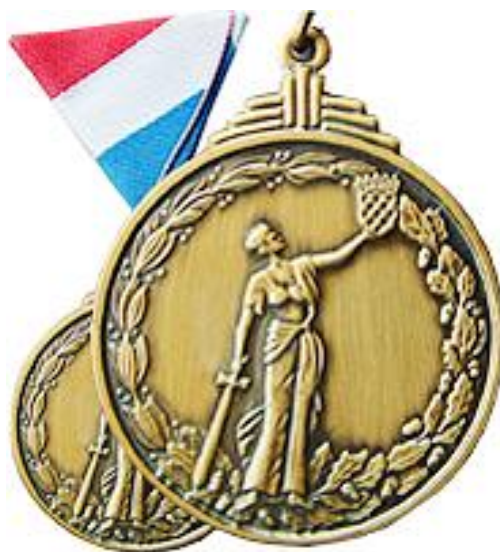
Lik žene na Spomenici domovinskog rata

Postoji li povezanost između ovih tema trebalo bi pokazati istraživanje koje će obuhvatiti širi korpus od djela na kojima se temelji ovo istraživanje, a to su ona s opisima opsada grada. Vjerujemo da bi nam ova zagonetna žena mogla još dosta toga reći o istraživanom djelu, ponajviše o vremenu njegovog nastanka. Žena, nalik onoj na Spomenici domovinskog rata, koju su dobili i branitelji opsjednutog Zadra, ali više od pola tisućljeća kasnije.