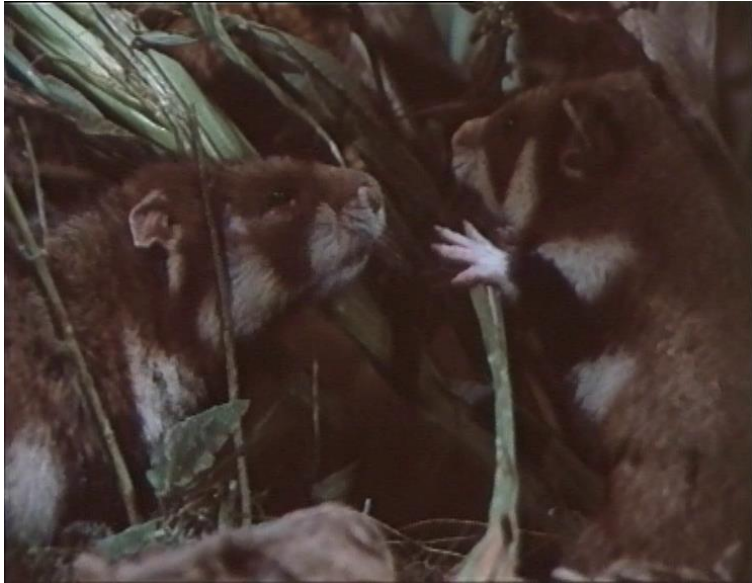
18. Mala čuda velike prirode br. 3 (Svadljivi hrčak)

Ma koliko noć bila mirna i blaga, ništa ne može razblažiti ovu prgavu narav. Hrčak je simbol dobra domaćina, ali i samoživa sebičnjaka. Misli samo na svoj drob i svoj hambar. Sve što nije on, nervira ga. Svaki šum koji nije sam proizveo, nervira ga. Čangrizljiv, razdražljiv, ljut, sav je živac. Ne trpi ni svoj rod, a kamoli stranca.