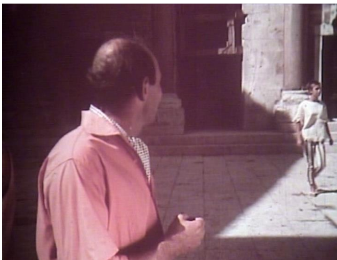
15. Turistički skerco