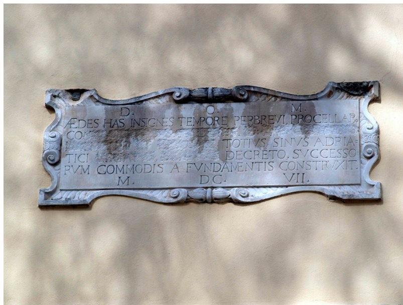
Slika 32. Natpis na latinskom jeziku kojemu je dlijetom uklonjen dio teksta.