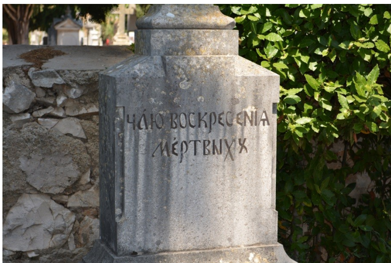
Slika 26. Nadgrobnji spomenik na ruskom jeziku i ćirilici (6.8.2013.)

Natpisi s nadgrobnih spomenika s Gradskog groblja pokazuju nam raznolikost koje više nema u vertikalnom jezičnom krajoliku Zadra, a možemo pretpostaviti da je takva raznolikost postojala i u javnom prostoru grada. Za vrijeme fašističke vlasti u Zadru javni je prostor također sadržavao mnoge režimske natpise i parole (v. Slika 27). Promjenama vlasti i režima vertikalni se jezični krajolik briše ili korigira te se postavljaju natpisi koji su u skladu s novom ideologijom.