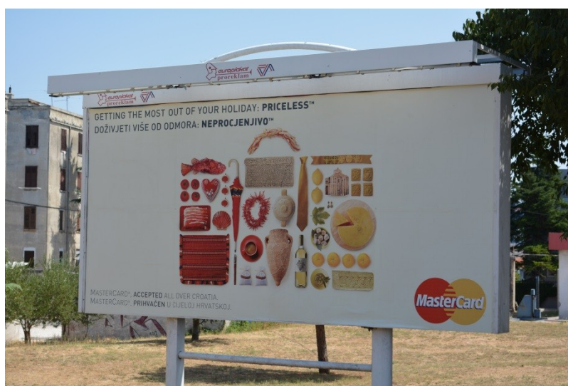
Slika 35. Reklama za kreditnu karticu na engleskom i hrvatskom jeziku (4.8.2013.).