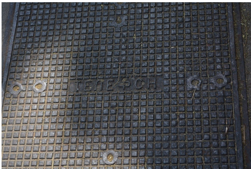
Slika 23. Natpis na srpskom jeziku i ćirilici na telekomunikacijskom šahtu (4.8.2013.)