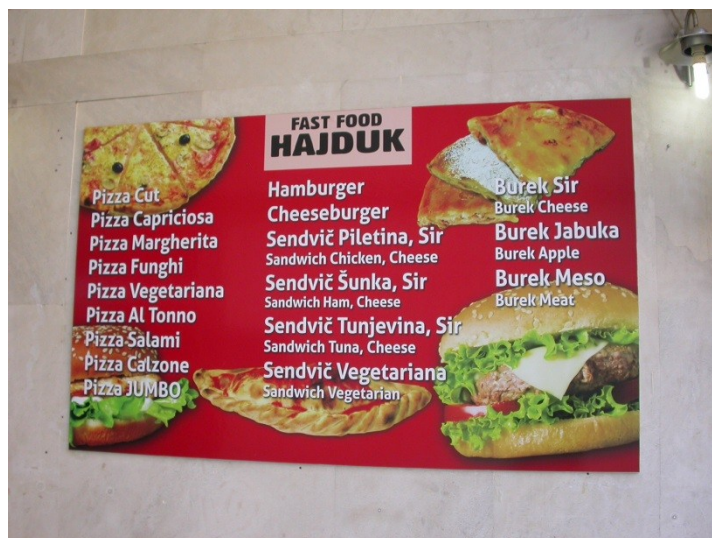
Slika 21. Reklamni natpis na ugostiteljskom objektu u Ulici knezova Šubića Bribirskih (11.9.2011.)