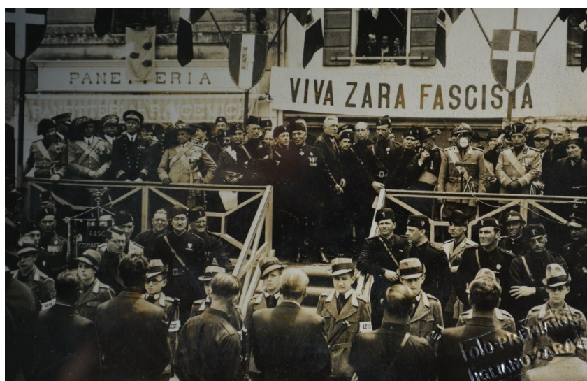
Slika 27. Jezični krajolik Zadra u vrijeme fašizma.

Natpisi s nadgrobnih spomenika s Gradskog groblja pokazuju nam raznolikost koje više nema u vertikalnom jezičnom krajoliku Zadra, a možemo pretpostaviti da je takva raznolikost postojala i u javnom prostoru grada. Za vrijeme fašističke vlasti u Zadru javni je prostor također sadržavao mnoge režimske natpise i parole (v. Slika 27). Promjenama vlasti i režima vertikalni se jezični krajolik briše ili korigira te se postavljaju natpisi koji su u skladu s novom ideologijom.