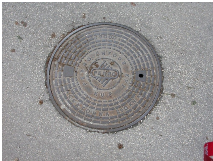
Slika 4. Kanalizacijski poklopac na mađarskom jeziku u Arbanasima (22.4.2012.)

Treći J1 je engleski s 2,45%, što je vrlo malo u usporedbi s drugim četvrtima. Rezultati pokazuju da je hrvatski jezik glavni način pisane komunikacije u javnom prostoru Arbanasa. Osim jezika prisutnih u jezičnom krajoliku značajno je da nema nijednog natpisa na arbanaškom jeziku; no, taj podatak ne začuđuje jer arbanaški nije nikad bio standardiziran ni korišten u pisanom obliku.