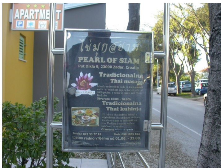
Slika 7. Reklama tajskog restorana i salona za masažu u ulici Put Dikla (28.4.2012.)

Gledajući prema žanru (Tab. 15), najveći broj natpisa odnosi se na objekte (OBJ) (55,72), što uglavnom uključuje kanalizacijske poklopce. Sljedeća su skupina reklamni natpisi (REK) (24,11%), što je razumljivo s obzirom da se radi o četvrti uz morsku obalu koja je turistički valorizirana i ima određen broj ugostiteljskih, trgovačkih i smještajnih prostora. Ostalih