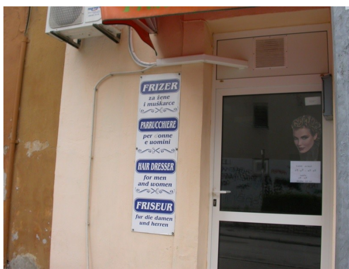
Slika 13. Reklama na hrvatskom, talijanskom, engleskom i njemačkom jeziku u Ulici Ivana Mažuranića (22.4.2012.)

Ako promotrimo koji su jezici prisutni na kojem žanru natpisa vidjet ćemo da je primjerice latinski prisutan na reklamama, što nam sugerira da se radi o tvrtkama koje su odabrale naziv na latinskom zbog zakona koji je dopuštao isključivo nazive na hrvatskom ili nekom od klasičnih jezika. Njemački i talijanski prisutni su na reklamama i informativnim natpisima, budući da mnogi proizvodi i usluge na hrvatskom tržištu dolaze iz Njemačke, odnosno iz Italije (v. Slika 13).