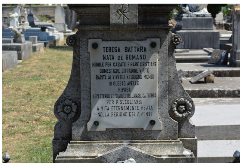
Slika 25. Nadgrobni spomenik na talijanskom jeziku (6.8.2013.)

Groblja se uglavnom nalaze u gradu ili na periferiji grada i istovremeno su dio grada i odvojena od grada (Vajta, 2017). Samim time neki društveni i politički procesi koji zahvate grad ne dohvate groblja. U gradovima koji su kroz povijest višekratno mijenjali vladare i kulturna obilježja groblja čuvaju spomen na sva ta razdoblja, često u segregiranim poljima (Piller, 2016). Tako se i zadarsko gradsko groblje dijeli na novi i stari dio, a taj stari obuhvaća i poseban dio iz 19. stoljeća u kojemu je primjetna višejezičnost i multikulturalnost iz tog doba. U tom dijelu groblja mogu se vidjeti nadgrobni spomenici i epitafi na njemačkom, hrvatskom, talijanskom, ruskom, srpskom i drugim jezicima, što svjedoči o raznolikosti zadarskoga društva u tom razdoblju (v. Slike 25 i 26).