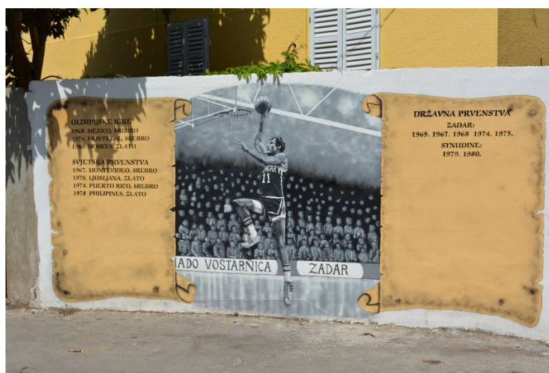
Slika 37. Mural na Voštarnici posvećen košarkašu Krešimiru Ćosiću (5.8.2013.)