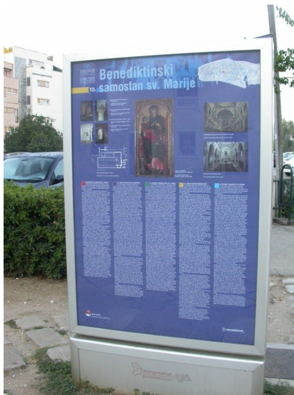
Slika 19. Informativni natpis o Samostanu sv. Marije na pet jezika (11.9.2011.)