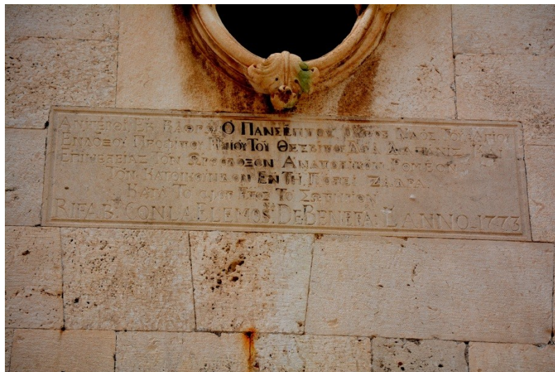
Slika 17. Natpis na grčkom i talijanskom jeziku na crkvi sv. Ilije Proroka na Poluotoku (14.7.2013.)

institucijama. Grčki i srpski jezici prisutni su u jezičnom krajoliku Poluotoka samo na po jednom natpisu, oba na srpskoj pravoslavnoj crkvi sv. Ilije Proroka, koja je u prošlosti služila grčkim trgovcima (v. Slika 17).