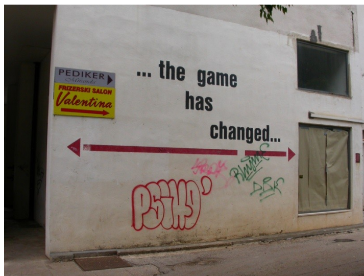
Slika 12. Kombinacija četiriju natpisa u Velebitskoj ulici: tri na hrvatskom i jedan na engleskom jeziku (22.4.2012.)

Na popisu drugih jezika (J2) natpisa vidimo opet da je engleski prvi (8,29%), hrvatski drugi (6,48%), a njemački treći (1,08%). Ponavlja se obrazac kao i u drugim četvrtima gdje je engleski najčešći drugi jezik, a hrvatski je na drugom mjestu.