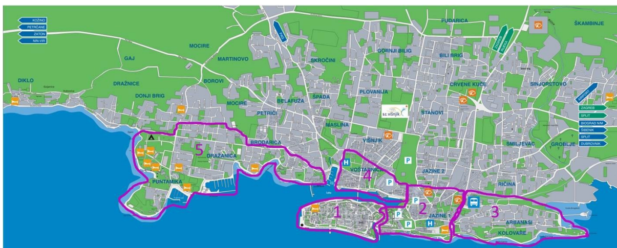
Slika 1. Područje uzorkovanja kod proučavanja jezičnoga krajolika Zadra

Razlog zašto smo odabrali baš ove dijelove grada jest u tome što je u njima najveći protok stanovništva na dnevnoj bazi, budući da se na Poluotoku, Jazinama, Relji i Voštarnici nalazi najveći dio državnih, gradskih, županijskih, sudskih i obrazovnih institucija, čime je kroz te četvrti primjetna i najveća komutacija stanovništva. Relevantnost protoka stanovništva na dnevnoj bazi očituje se u tome što će u tim dijelovima grada posljedično biti i više natpisa usmjerenih prema tom stanovništvu, a samim time je i utjecaj jezičnoga krajolika veći jer ga konzumira veći broj prolaznika. Drugim riječima, jezični krajolik u tim četvrtima ima najveći utjecaj na prolaznike, a veći broj prolaznika ima najveći utjecaj na količinu i sadržaj natpisa u jezičnom krajoliku.