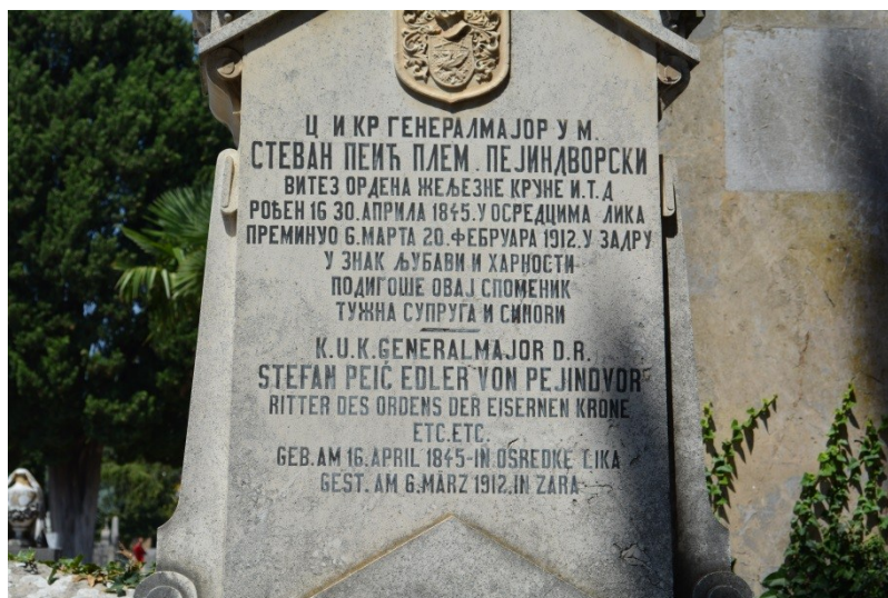
Slika 24. Dvojezičan srpsko-njemački natpis na nadgrobnom spomeniku iz 1912.g. (6.8.2013.)

Groblja se uglavnom nalaze u gradu ili na periferiji grada i istovremeno su dio grada i odvojena od grada (Vajta, 2017). Samim time neki društveni i politički procesi koji zahvate grad ne dohvate groblja. U gradovima koji su kroz povijest višekratno mijenjali vladare i kulturna obilježja groblja čuvaju spomen na sva ta razdoblja, često u segregiranim poljima (Piller, 2016). Tako se i zadarsko gradsko groblje dijeli na novi i stari dio, a taj stari obuhvaća i poseban dio iz 19. stoljeća u kojemu je primjetna višejezičnost i multikulturalnost iz tog doba. U tom dijelu groblja mogu se vidjeti nadgrobni spomenici i epitafi na njemačkom, hrvatskom, talijanskom, ruskom, srpskom i drugim jezicima, što svjedoči o raznolikosti zadarskoga društva u tom razdoblju (v. Slike 25 i 26).