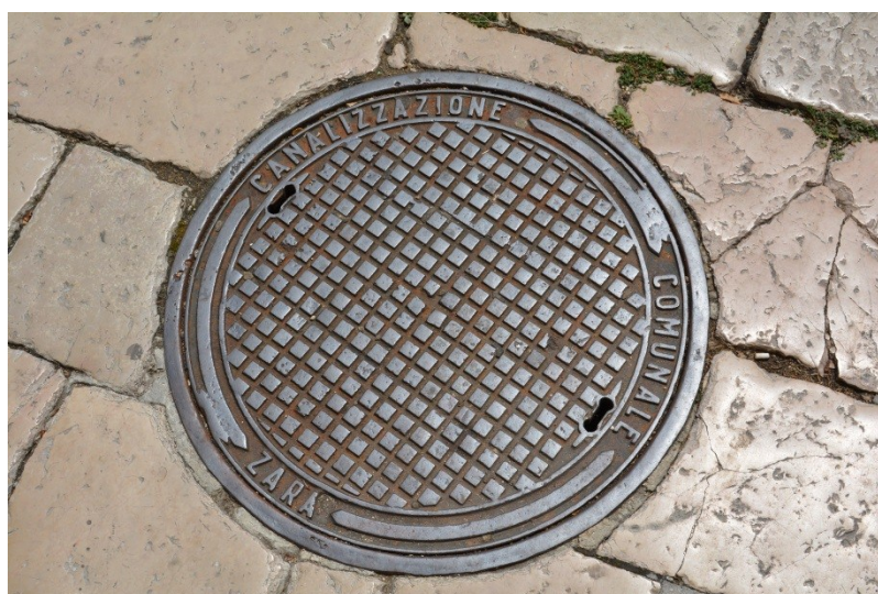
Slika 16. Kanalizacijski poklopac na talijanskom jeziku iz razdoblja talijanske uprave (Poluotok, 14.7.2013.)

Latinski jezik prisutan je na natpisima u jezičnom krajoliku ponajviše na epigrafskim natpisima iz prošlih stoljeća te na nekim trgovačkim ili ugostiteljskim natpisima. Razlog uporabe latinskoga jezika na suvremenim natpisima zasigurno leži u hrvatskoj zakonskoj regulativi prije ulaska u Europsku uniju, koja je propisivala da naziv tvrtke mora biti na hrvatskom jeziku ili nekom od klasičnih jezika. U toj situaciji mnogi su poduzetnici birali radije latinske nego grčke riječi za svoje tvrtke. Neki od današnjih primjera su „Auro domus“ ili „Idassa Atrium“. Francuski se jezik pojavljuje uglavnom u dvije djelatnosti, ugostiteljskoj ili trgovačkoj. Njemački se pojavljuje na natpisima u ugostiteljstvu, zlatarstvu i financijskim