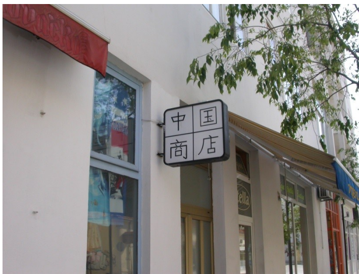
Slika 9. Reklama na kineskom jeziku na Relji (28.4.2012.)

Osim pretežitog latiničnog pisma, u jezičnom krajoliku ove četvrti nalazimo kinesko pismo i glagoljsko pismo. Kinesko pismo korišteno je na reklamama i u izlogu kineske trgovine (v. Slika 9), dok je glagoljsko pismo korišteno na grafitu posvećenom zadarskom nogometnom i košarkaškom klubu (v. Slika 10). Osim na grafitu, glagoljica je prisutna i u Glagoljaškoj ulici koja se nalazi odmah pored Samostana sv. Ivana Krstitelja u kojem franjevci trećoređci stoljećima čuvaju glagoljaštvo (v. Slika 11). Istočni zid Glagoljaške ulice urešen je kamenim pločama u koje su uklesana sva glagoljska slova. S obzirom na dinamiku jezičnoga krajolika, u 2019. godini kineskoga teksta više nema u javnom prostoru ove gradske četvrti, dok je glagoljica i dalje prisutna: kameni natpisi su i dalje tamo, no grafit bi mogao biti uklonjen zbog intenzivnih građevinskih radova u pozadini zida na kojem se tekst nalazi.