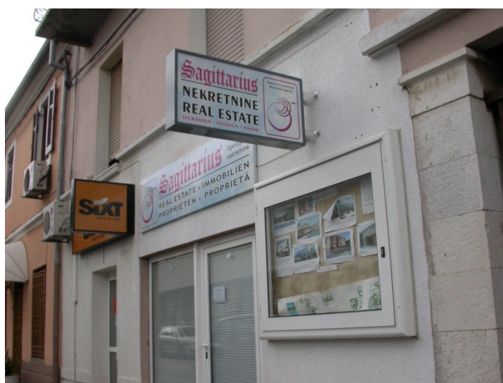
Slika 14. Latinski jezik u nazivu agencije za promet nekretnina u Ulici Ivana Mažuranića (22.4.2012.)

Ako bismo promotrili koji su jezici zastupljeni u određenim djelatnostima, vidjeli bismo da je hrvatski najviše prisutan na natpisima infrastrukturnih (39,99%), trgovačkih (13,35%), financijskih (3,34%) i medicinskih djelatnosti (2,75%). Engleski je najviše prisutan kod trgovačkih (4,37%) i računalnih djelatnosti (1,03%). Latinski je prisutan kod financijskih i građevinskih djelatnosti, te kod djelatnosti koje se bave prodajom nekretnina i pružanjem intelektualnih usluga. Međutim, ti podaci ne znače da se u tim djelatnostima latinski rabi kao jezik komunikacije; latinski je tamo prisutan zbog činjenice da je odabir naziva tvrtke u Republici Hrvatskoj prije ulaska u Europsku uniju bio reguliran zakonom koji je dopuštao nazive na hrvatskom jeziku ili jednom od klasičnih jezika, pa su mnogi vlasnici odabirali latinske riječi za nazive svojih tvrtki (primjerice „Sagittarius nekretnine“ (Slika 14).