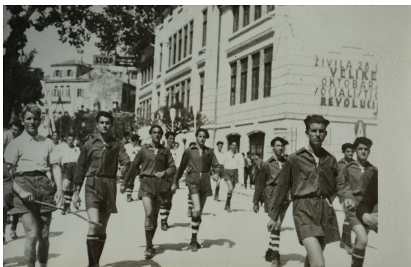
Slika 30. Natpisi iz razdoblja komunizma.