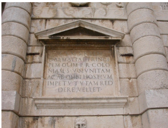
Slika 2. Latinski natpis na Kopnenim vratima (11.9.2011.)