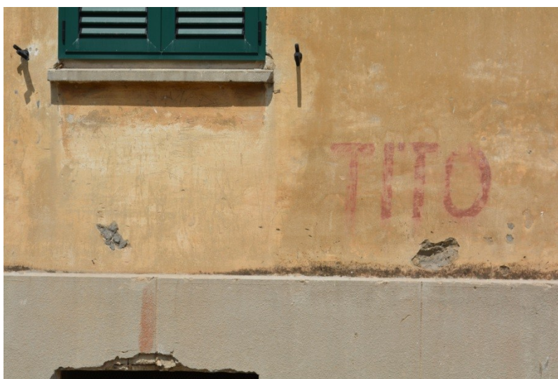
Slika 28. Djelomičan natpis iz razdoblja komunizma u Ulici E. Kvaternika (4.8.2013.).

Poslije Drugog svjetskog rata uklonjeni su gotovo svi natpisi u vertikalnom jezičnom krajoliku grada iz razdoblja talijanske uprave. Te natpise zamijenili su natpisi na hrvatskom jeziku. S obzirom da je razdoblje od Drugog svjetskog rata do Domovinskog rata bilo obilježeno komunističkom propagandom, javni je prostor obilovao natpisima, parolama i sloganima u duhu toga vremena. Takvih natpisa danas više nema, a jedini koji je preostao u parcijalnom obliku zabilježen je u Ulici Eugena Kvaternika (v. Slika 28), no u 2019. godini više ga nema jer je fasada te zgrade obnovljena, a natpis prebojan.