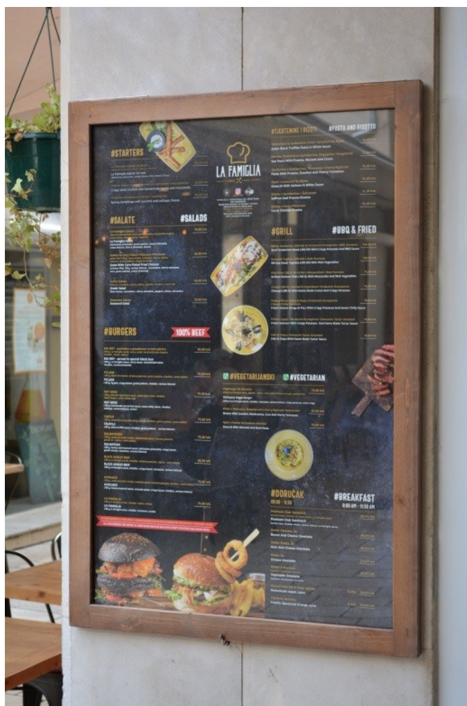
Slika 22. Reklamni natpis na preimenovanom ugostiteljskom objektu u Ulici knezova Šubića Bribirskih (14.10.2018.)