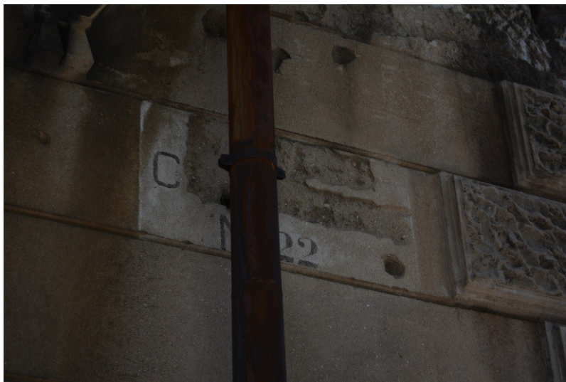
Slika 31. Ploča s nazivom ulice iz razdoblja talijanske uprave, danas u Ulici Bože Peričića (4.8.2013.).

U zadarskom jezičnom krajoliku nije, dakle, zanimljivo samo ono što tamo jest, već je zanimljivo i ono čega nema. Iz primjera Gradskog groblja te s fotografija i razglednica Zadra možemo vidjeti da je nekadašnja jezična raznolikost bila bogata, ali u vertikalnom jezičnom krajoliku Zadar ta se raznolikost više ne vidi, što znači da je kroz prošla desetljeća ona izbrisana tijekom društvenih promjena. Tragovi tih promjena najbolje se vide na kamenim pločama iz prethodnih stoljeća koje sadrže tekstove na latinskom ili talijanskom jeziku (v. Slika 32), a neki dijelovi tih tekstova uklonjeni su dlijetom i čekićem. Na Slici 31 uklonjen je naziv ulice na talijanskom jeziku, a ostavljen je kućni broj. Na slične ploče iz razdoblja talijanske uprave samo je odozgo dodana ploča na hrvatskom jeziku.