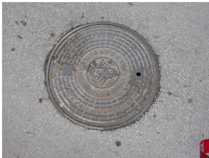
Slika 4. Kanalizacijski poklopac na mađarskom jeziku u Arbanasima (22.4.2012.)

Treći J1 je engleski s 2,45%, što je vrlo malo u usporedbi s drugim četvrtima. Rezultati pokazuju da je hrvatski jezik glavni način pisane komunikacije u javnom prostoru Arbanasa. Osim jezika prisutnih u jezičnom krajoliku značajno je da nema nijednog natpisa na arbanaškom jeziku; no, taj podatak ne začuđuje jer arbanaški nije nikad bio standardiziran ni korišten u pisanom obliku.