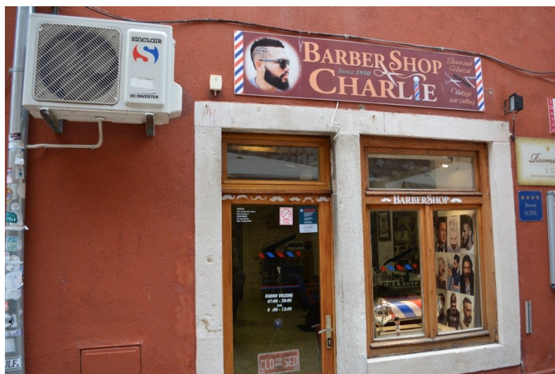
Slika 33. Brijučnica u ulici Špire Brusine (21.10.2018.).