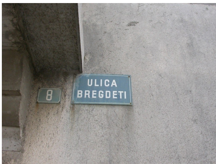
Slika 5. Ploča s nazivom ulice u Arbanasima (22.4.2012.)

Zaključno, Arbanasi se nalaze na periferiji područja koje smo analizirali i primarno su stambenog karaktera s vrlo malim brojem poslovnih prostora i djelatnosti. Zbog toga je najveći broj natpisa u javnom prostoru infrastrukturnog karaktera i službenog autorstva (v. Slika 5). Samo četvrtina natpisa privatnog je autorstva, a takvi natpisi uglavnom pripadaju ugostiteljskoj, trgovačkoj ili smještajnoj djelatnosti. Hrvatski je najčešći jezik u jezičnom krajoliku Arbanasa. Mađarski je drugi, ali nema nikakvu simboličku ili informativnu funkciju jer je njegova prisutnost slučajna. Iz svih je primjera jasno da je hrvatski glavni jezik pisane komunikacije u javnom prostoru Arbanasa. Značajno je i da u jezičnom krajoliku nije zabilježen nijedan primjer teksta na arbanaškom jeziku.