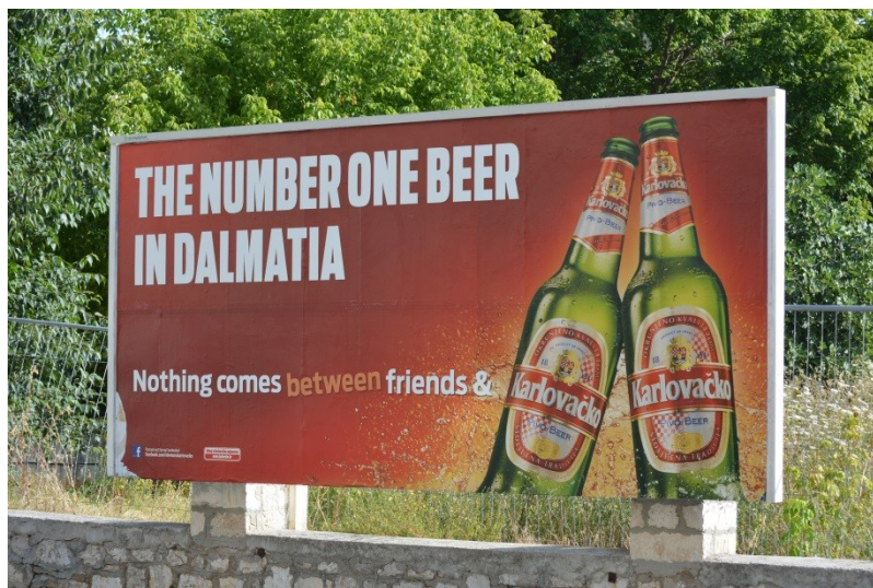
Slika 34. Reklama za hrvatsko pivo na engleskom jeziku (4.8.2013.).

razmišljanja jest pragmatičnost zbog koje nema potrebe stavljati tekstove na stranom jeziku izvan turističke sezone jer ih tada ionako nema tko čitati.