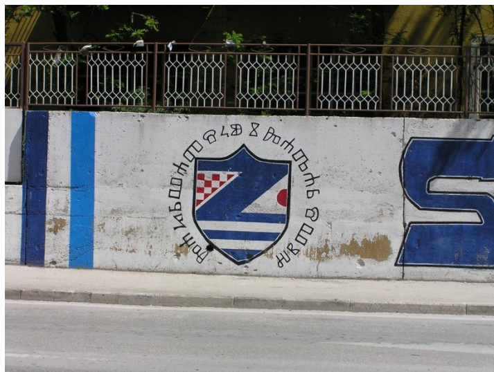
Slika 10. Grafit na hrvatskom jeziku i glagoljskom pismu u Ulici Dr. Franje Tuđmana (28.4.2012.)