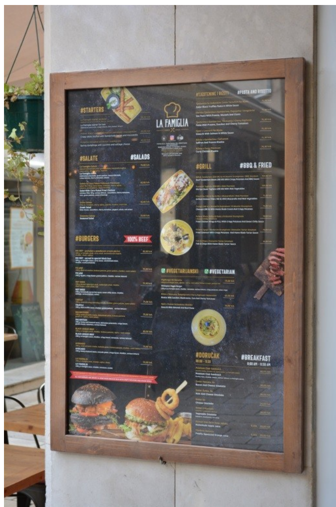
Slika 22. Reklamni natpis na preimenovanom ugostiteljskom objektu u Ulici knezova Šubića Bribirskih (14.10.2018.)