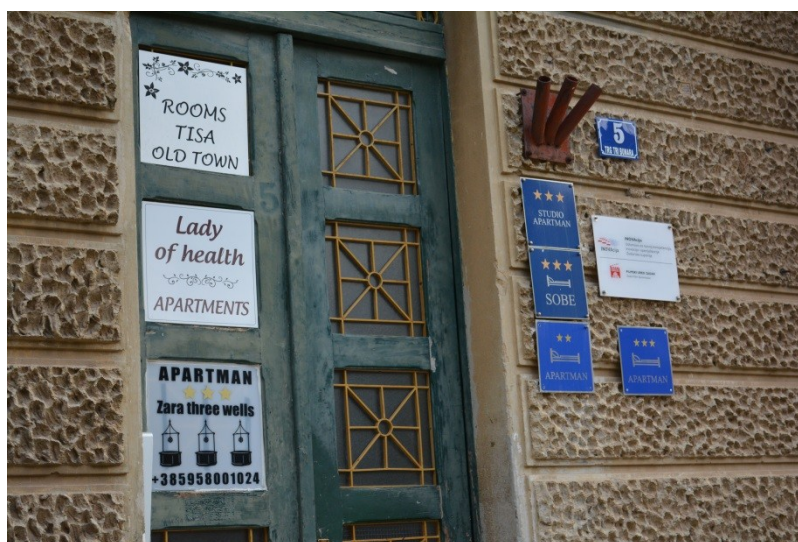
Slika 18. Natpisi na engleskom jeziku (lijevo) te na hrvatskom jeziku (desno) za smještajne jedinice na Trgu Tri bunara (14.10.2018.)

(23,10%), koji uglavnom uključuju ploče s nazivima ulica, prometne znakove, objekte u prostoru, parkirne automate i znakove; kod trgovačkih (TRG) natpisa (13,29%) i ugostiteljskih (UGO) natpisa (6,31%), koji uključuju obavijesti o radnom vremenu i podatke o tvrtki; kod smještajnih (SMJ) natpisa (5,45%), koji uključuju pločice s vrstom smještajnog prostora koje su zakonski propisane; i druge vrste koje su zastupljene u manjem broju.