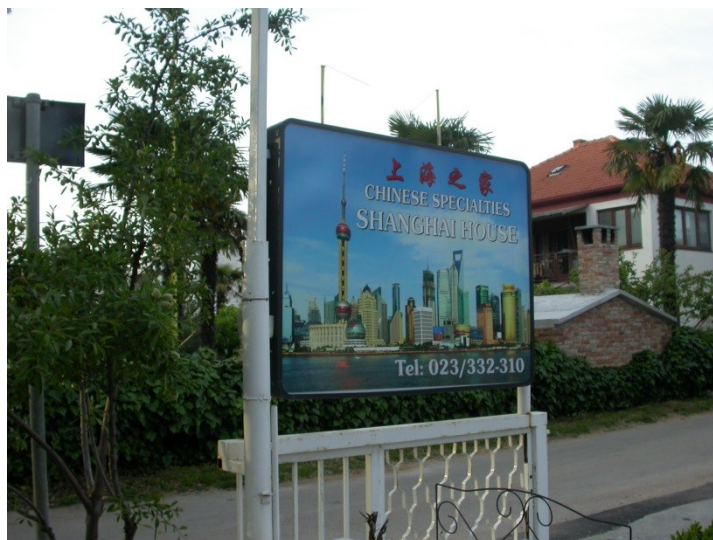
Slika 6. Reklama kineskog restorana u ulici Put Dikla (28.4.2012.)

da ih u 2019. godini više nema, dok je kineski restoran i dalje na istoj lokaciji u vrijeme pisanja ovoga teksta u ljeto 2019.