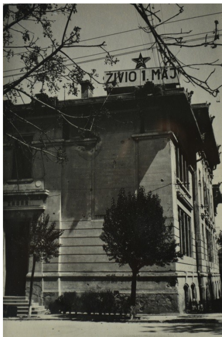
Slika 29. Natpis iz razdoblja komunizma (fotografija iz zbirke Zvonimira Šuljka).