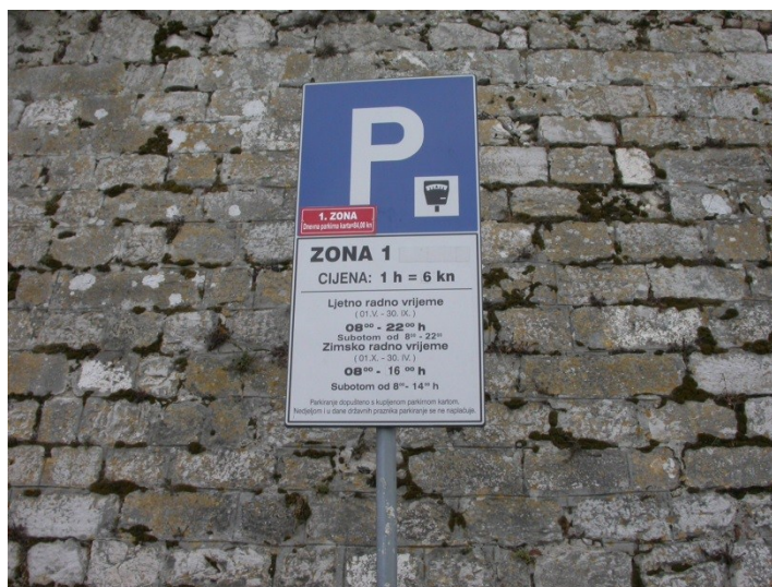
Slika 3. Prometni znak na parkiralištu (11.9.2011.).

Prema redoslijedu pojavljivanja na natpisu hrvatski je prvi jezik na velikom broju natpisa (Tab. 8) koji pripadaju infrastrukturnom sektoru (INF) (27,04%). Takvi su natpisi uglavnom postavljeni od strane gradskih institucija i uključuju ploče s nazivom ulice, parkirne automate, kanalizacijske poklopce i prometne znakove. Važno je primijetiti da su 2011. godine parkirni automati imali vrlo malo teksta prevedenog na engleski jezik i to tiskanog sitnim slovima tako da je njihova korist u turističkoj sezoni zasigurno bila upitna. Ostali infrastrukturni natpisi, posebice prometni znakovi (v. Slika 3) koji se također odnose na parkiranje, bili su isključivo na hrvatskom jeziku. Hrvatski je prvi jezik i kod velikog broja trgovačkih natpisa (TRG) (16,76%).