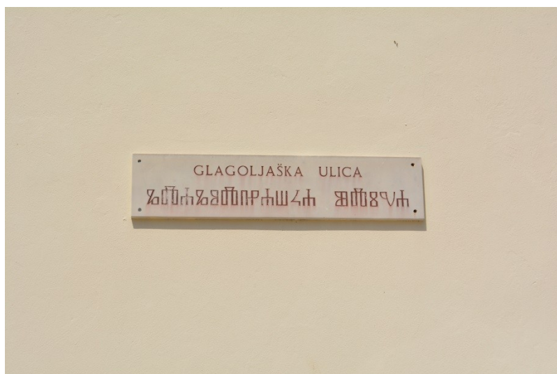
Slika 11. Latinica i glagoljica na natpisu u Glagoljaškoj ulici (4.8.2013.)

Zaključno, u četvrti Relja i Jazine primjećuje se polagan rast broja privatnih natpisa i rast broja višejezičnih natpisa. Privatni natpisi generiraju veću raznolikost u jezičnom krajoliku. Hrvatski je najbrojniji prvi jezik natpisa te je 2. na popisu drugih jezika natpisa. Engleski jezik slijedi hrvatski na popisu prvih jezika natpisa, dok je na vrhu popisa drugih jezika natpisa. Taj nam podatak govori da je hrvatski primarni jezik pisane komunikacije ove gradske četvrti, a engleski služi kao pomoćni jezik. Uz ta dva jezika mogu se vidjeti i talijanski i njemački. Hrvatski je najčešći na reklamama, objektima i na informativnim natpisima, dok je engleski najviše prisutan na reklamama. Relja i Jazine su prvenstveno