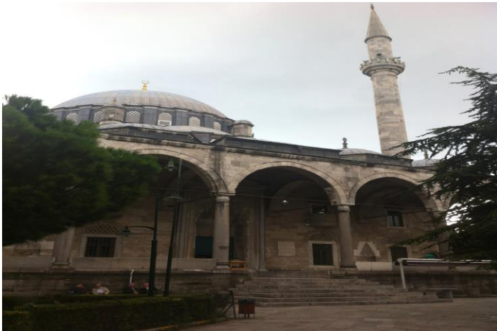
Slika broj 2. Dijelovi Ali-pašinog vjerskog kompleksa ( külliye ): džamija, knjižnica i turbe