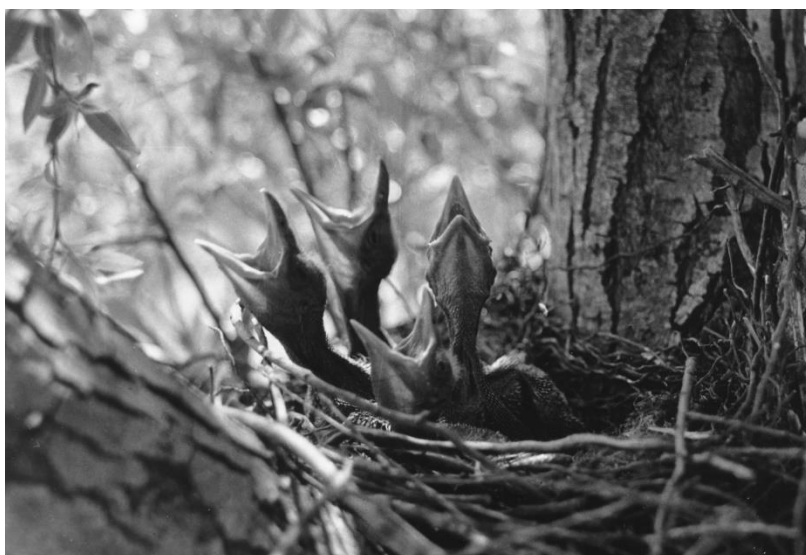
23. Briga za potomstvo

animatora u tramvaju, 99 a truba zvukovno imitira padanje zgužvanih crteža nezadovoljna animatora u koš za smeće te animirano hodanje i zijevanje lika kojeg je animator nacrtao. Imitatorski efekt ostvaruje se i upotrebom prirodnog zvuka, kada se zvukom udaranja pisaćeg stroja imitira lupkanje animatora prstima po glavi, čime se metaforično ukazuje na činjenicu da animator u glavi stvara ideju o svom crtiću. U filmu Baltazar putuje činele bubnja imitiraju Baltazarovo rušenje ljudi i stvari, a kada Baltazar odgurne cijeli red ljudi, čuje se zavijajući zvuk trube. U filmu o prirodi Briga za potomstvo (Branko Marjanović, 1959, HRV), pak, žustri zvuci puhaćeg instrumenta imitiraju energično otvaranje usta gladnih ptića (fotografija 23), klavirski akcent imitira batrganje leptira u paukovoju mreži, zviždukanje flaute imitira glasanje kolibrića, a puhaći instrument imitira ptice koje se podrugljivo smiju orlu koji ih nije uspio uhvatiti, kako nam sugerira narator.